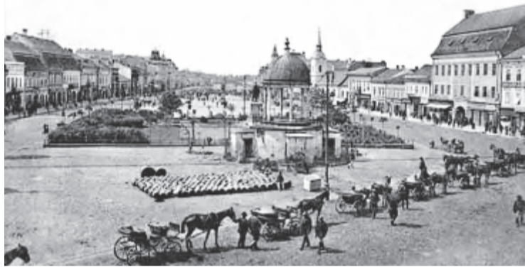
Marosvásárhelyi látkép Bodor kútjával a XIX. századból

Az árvíz a víz szintjének olyan mértékű emelkedése, amikor az a medrétől kilép, és hatalmas területeket borít el, leírhatatlan pusztítást okozva – az emberi történelem során mindmáig állandó visszatérő, természeti veszély volt. A nyári hirtelen esőzések vagy a tavaszi áradások hatása újszólván teljesen kiszámíthatatlan. Mezőgazdasági termőterületek, lakott települések, ipari létesít-