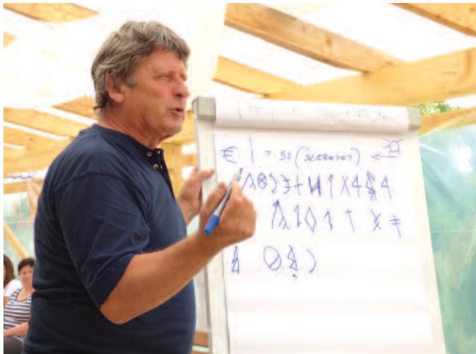
Mindenhol, mindenkinek szívesen és ingyen oktatja ősi írásmódunkat

– Amióta megtanultam, azóta tanítok másokat is. Ha szenvedéllyé válik, akkor képtelen ettől megszabadulni az ember, és egyes szektákhoz hasonlóan – akik foggal-körömmel át akarják adni a tudományukat – én is próbálok megismertetni másokkal, ha olyan társaságban vagyok. Szoktam is mondani, hogy az én barátain nem írástudatlanok, márpedig az, aki a rovásírást nem ismeri, az a magyarság szempontjából írástudatlan. Ugyanis mi latin betűkkel írunk, ami megnehezíti a nyelvünket, s ezért kellett betűket „összeházasítanunk” – például t+y, s+z –, hogy a 38 hangunkat tudjuk írásban is kimutatni, de ez azóta sem sikerül, hiába teszünk