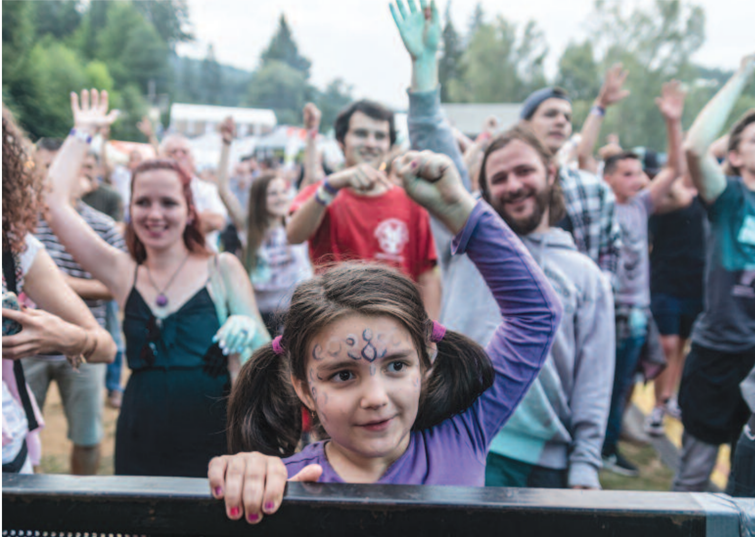
Balkán Fanatik-koncert szerda este