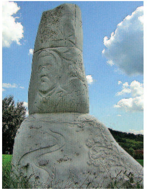
Örökzöld borostyán futja körbe Borbás Vince szobrának talapzatát

Tizenkét könyvet másolok. Zsibongon állnak elem a képek és ahányat pillantok, annyi égi, szép leányhad forog elem egy nagy, piros korongon.