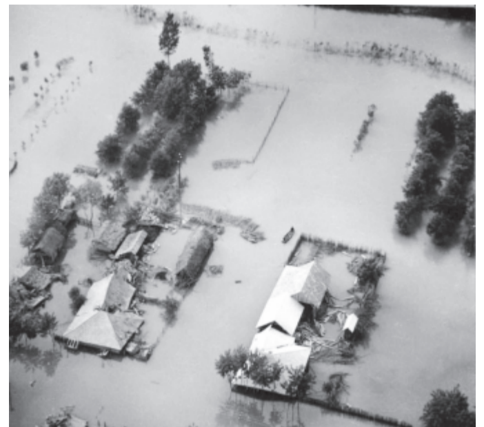
Az 1975-ös árvíz