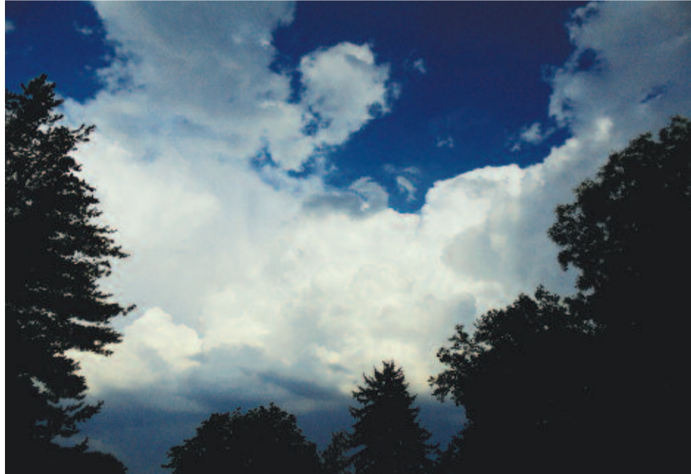
Meg-megakad a szél lomhán egy-egy vén fenyőfa lombján

Nagy udvara van a holdnak: eső lesz holnap. Nem ártana már egy csendes